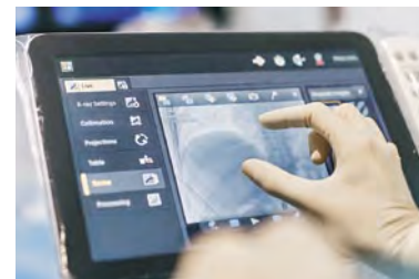
Philips Azurion: Innovative Bildgebungslösung