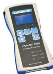
InControl 1050 Labotect GmbH