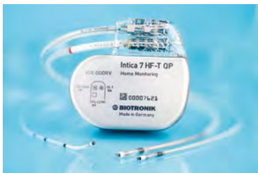
Neues CRTD Implantat Intica 7 HF-T QP von Biotronik